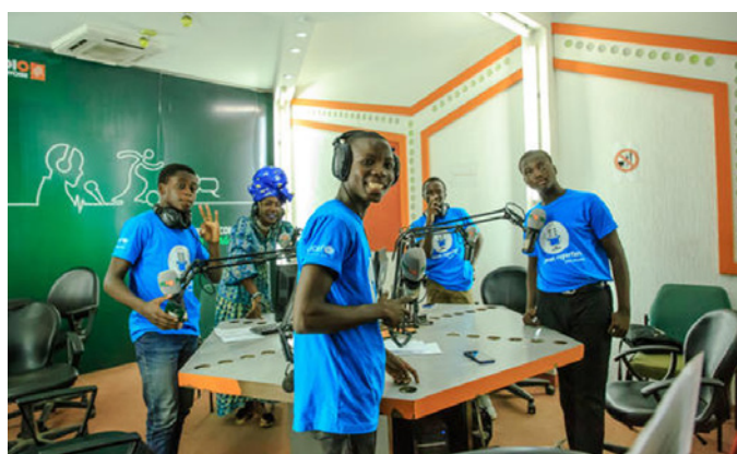
El Día Internacional de la Infancia, jóvenes periodistas tomaron el control de Radio Côte d'Ivoire en Abidjan.

“Vengo de los campos de cultivo de té de Darjeeling. Mi padre es el único que trabaja, y gana unas 100 rupias al día. Es muy difícil cubrir las necesidades básicas de la familia. Hace 6 años que mi madre padece tuberculosis. Desde entonces está en el hospital, de modo que tengo que cuidar a mi hermana y además ocuparme de mis estudios. Me presentaron a una ONG llamada Anugalaya, que gestiona el programa Parlamento de los Niños. Después de incorporarme a él, mi capacidad de reflexión aumentó, mis procesos mentales cambiaron, y me convencí de que debía trabajar en favor de otros niños. A través de mi labor, recaudé dinero para que un niño recibiera tratamiento contra el cáncer. Ahora me han elegido Ministro de Finanzas del Parlamento regional. Deseo que todos los niños de la India tengan una vida feliz, segura y saludable”.